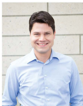
Havixbeck, im November 2021